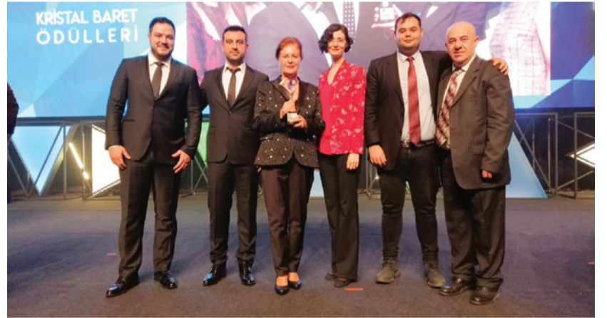
'Kristal Baret Ödül Töreni' Lutfi Kırdar Kongre ve Sergi Sarayında düzenlendi.