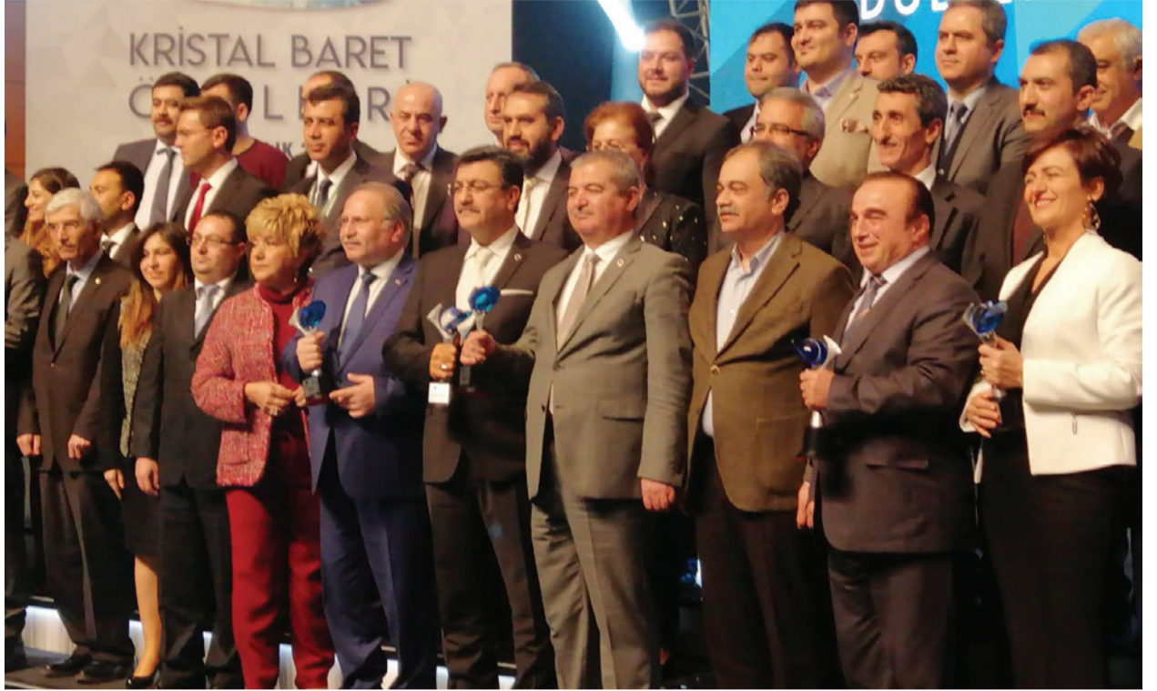
İstanbul Yeni Yüzyıl Üniversitesi, İstanbul Büyükşehir Belediyesi tarafından verilen ve İş Sağlığı ve Güvenliği alanında Türkiye'nin en prestijli ödülü olarak tanımlanan 'Kristal Baret Ödülü'nü aldı.