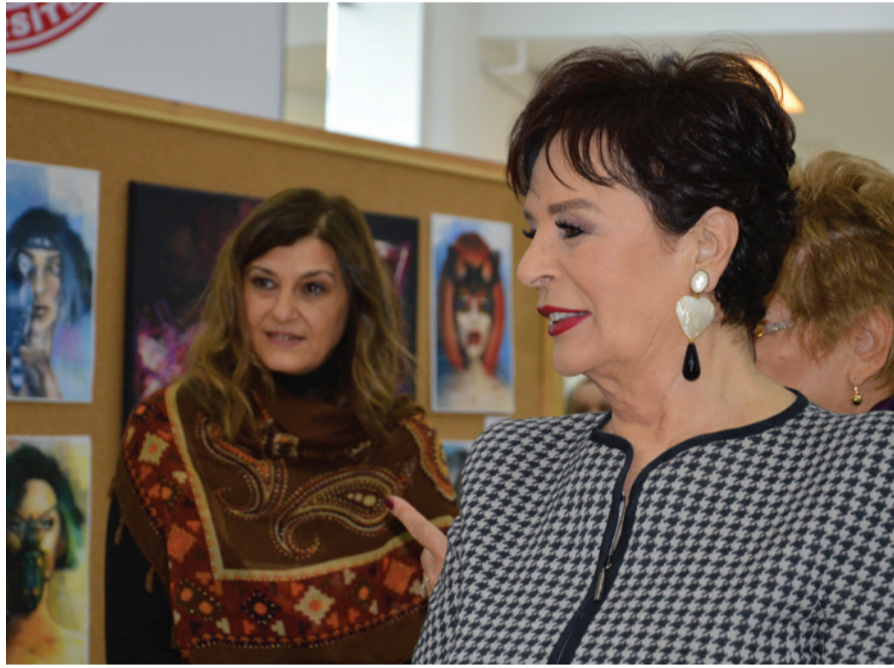
Hülya Koçyiğit program sonrasında resim sergisini de ziyaret etti.

Söyleşide, kadına şiddet ve çocuk gelinler konusuna değinen Koçyiğit, "İçimi acıtan bir durumu yıllardır yaşıyoruz. Çocuk gelinlerden bahsediyorum. Genelde sosyo-ekonomik nedenlerle o çocuk yaşta kızlar evlendiriliyor" dedi. Evliliğin bireyin kendi seçimiyle verebileceği bir karar olduğunu dile getiren Hülya Koçyiğit, şunları söyledi: "Ancak bu hak ellerinden ne yazık ki alınıyor. Çocuk yaşta hem ailelerinden uzaklaştırılıyorlar hem de kişisel gelişimleri, eğitimleri daha tamamlanmamış oluyor. Ve her türlü özgürlükleri engellenmiş oluyor. Medyadan bu konudaki gelişmeleri yakından takip ediyoruz, bizler sinemaya aktarmaya çalışıyoruz,