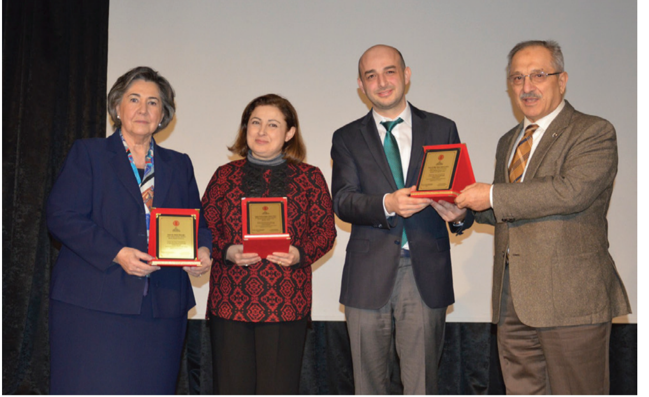
Hukukçular, sempozyumda kadın haklarına yönelik düzenlemeler, nafaka hukukundaki son durum, milletlerarası hukukta kadının soyadı gibi birçok konuyu ele aldı.