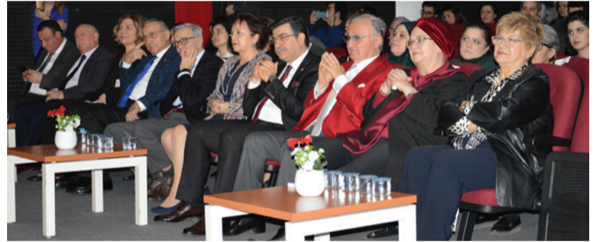
Alev Ofluoğlu Konferans Salonu'ndaki törene katılım yüksek oldu.